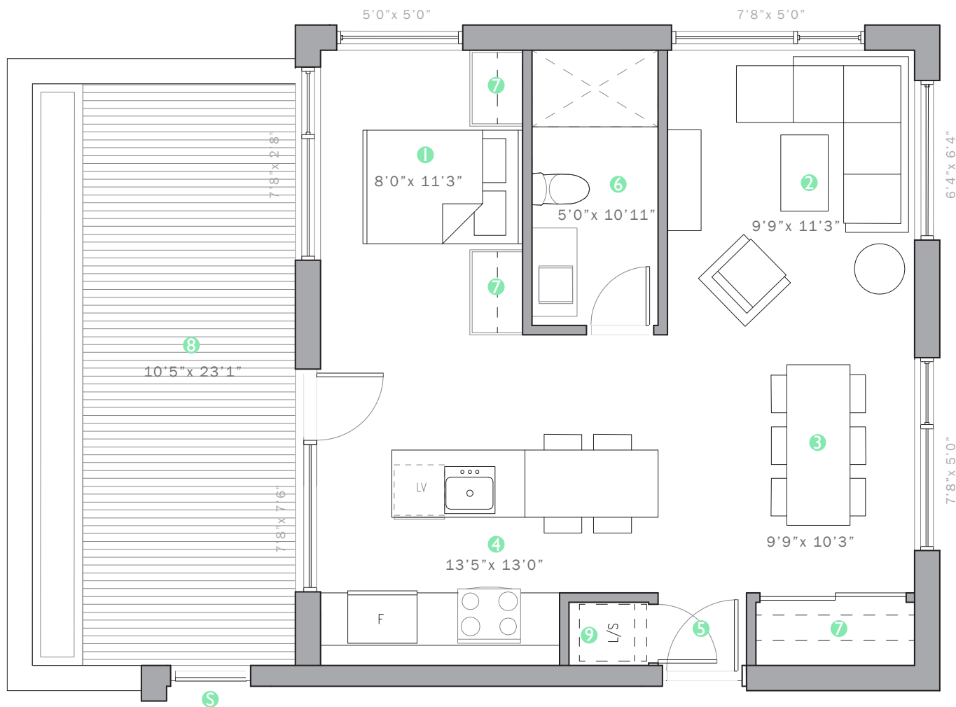
NIVEAU 4 (OPTION 1) - 672 PI.CA