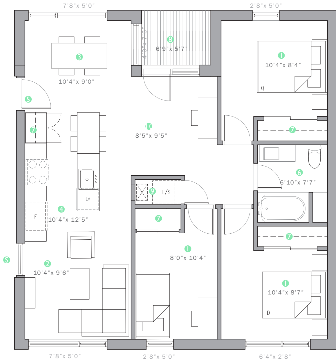
NIVEAU 0 (OPTION 1) - 996 PL.CA